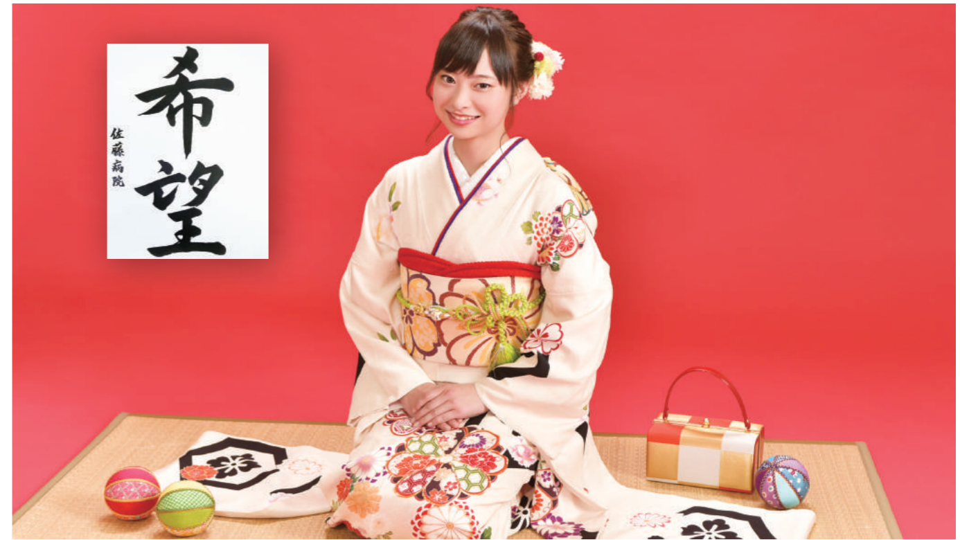
モデル: 佐藤病院スタッフ、書道: 佐藤病院書道部

Make a flow ~流れを創る~ 毎年、経営企画室が年間目標とともに作るスタッフ行動指針となるスローガン。産婦人科を取り巻く問題は数々ありますが、私たちが自ら流れを創り出し、地域の女性の健康を多方面からサポートしようという想いが込められています。水は低きに流れ、人は易きに流れるとも言いますが、時には流れに上手に乗り、時には流れに逆らいながらも、2020年を勇往邁進していきたいと思っています。(紫)