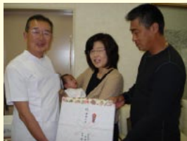
1ヶ月健診でお父さまと。院長より記念のアルバムが贈られました。