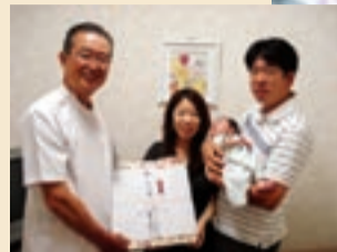
院長より1000人目記念のアルバムが贈られました