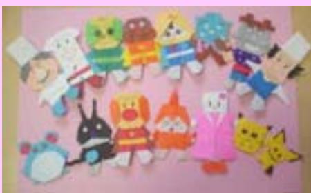
今、託児室で大人気のアンパンマン折り紙の折り方を差上げています。受付まで！